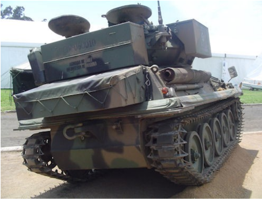
Scorpion chilijskiej piechoty morskiej - Infanteria de Marina w wersji wsparcia z działem kal. 76 mm

Z 16 ex-hiszpańskich wozów przejętych przez Chile 13 jest w wariantcie transportera piechoty, jeden w odmianie dowodzenia, zaś 3 pozostałe służyć mają jako zbiornice części zamiennych (po kanibalizacji).