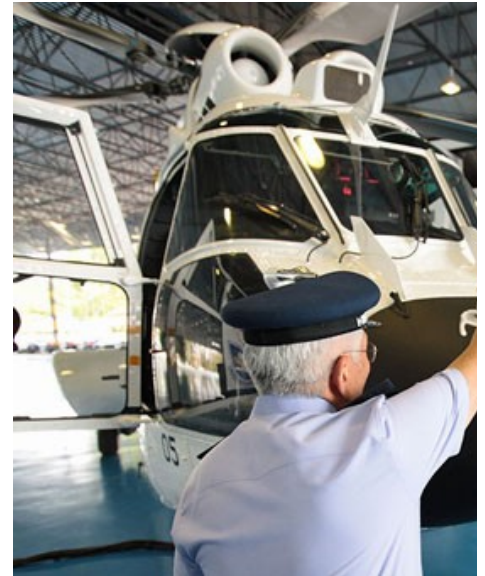
Brazylijska marynarka wojenna i wojska lądowe mają otrzymać po 16 śmigłowców , a wojska lotnicze 18, w tym 2 skonfigurowane do transportu VIP

Produkcja EC725 jest częścią umowy zawartej 30 czerwca 2008 przez ministerstwa obrony Brazylii i Francji dotyczącej współpracy Eurocoptera i Helibras. Umowa zakłada, że Brazylia zamówi 50 wielozadaniowych EC725. Będą one produkowane przez Helibras. Wśród zamówionych śmigłowców znalazły się 2 przeznaczone dla specjalnej grupy transportowej (ETG), która zabezpiecza loty prezydenta.