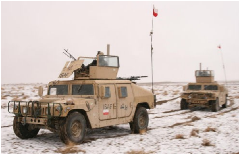
Zdjęcia: Krzysztof Wilewski, Sekcja Informacyjno - Prasowa, PKW Afganistan

© Wszelkie prawa zastrzeżone, 2007-2026 Altair Agencja Lotnicza Sp. z o. o