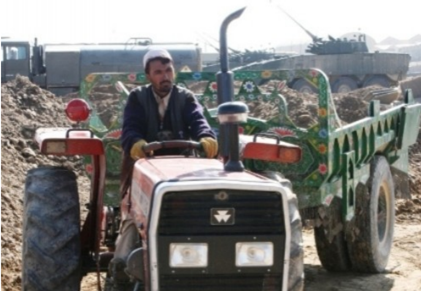
Baza przypomina dzisiaj wielki plac budowy. Prace wykonują miejscowi robotnicy pod nadzorem amerykańskich i polskich inżynierów wojskowych. W tle, za traktorem, polskie Rosomaki i cysterna na podwoziu Jelcza

W pracach biorą udział także polscy żołnierze. Stacjonuje tu bowiem dowództwo Polskiej Grupy Bojowej i Narodowy Element Zaopatrywania Polskiego Kontyngentu Wojskowego w Afganistanie.