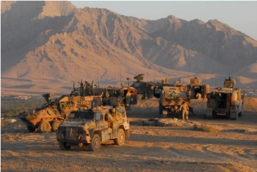
Grupa australijskich samochodów patrolowych Bushmaster i transporterów opancerzonych ASLAV w prowincji Oruzgan. Misja w Afganistanie jest najdroższym przedsięwzięciem zagranicznym Australii. Utrzymanie tysięcznego kontyngentu kosztuje rocznie ponad 575 mln USD

Poważnym problemem, podobnie jak innych państw posiadających armie zawodowe, jest przyciągnięcie do służby odpowiedniej liczby kandydatów. Dlatego planuje się również, m.in. wzrost sum na opiekę lekarską dla rodzin żołnierzy.