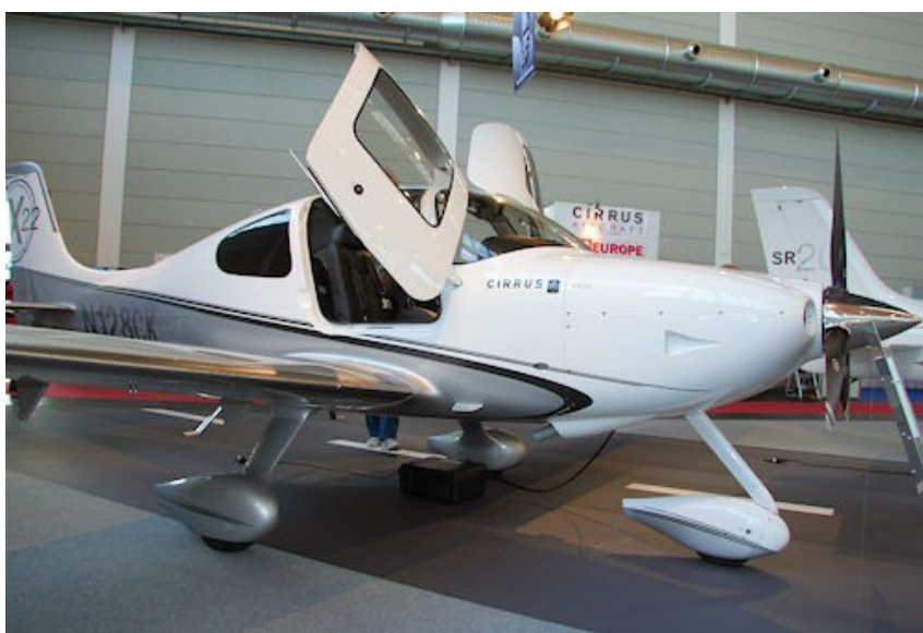
Pokazany po raz pierwszy Cirrus SR22 GTS X-Edition

Przedstawiciele Cirrus Design spodziewają się uzyskać certyfikat dopuszczający Cirrusa do lotów w znanych warunkach oblodzenia jeszcze w pierwszej połowie tego roku.