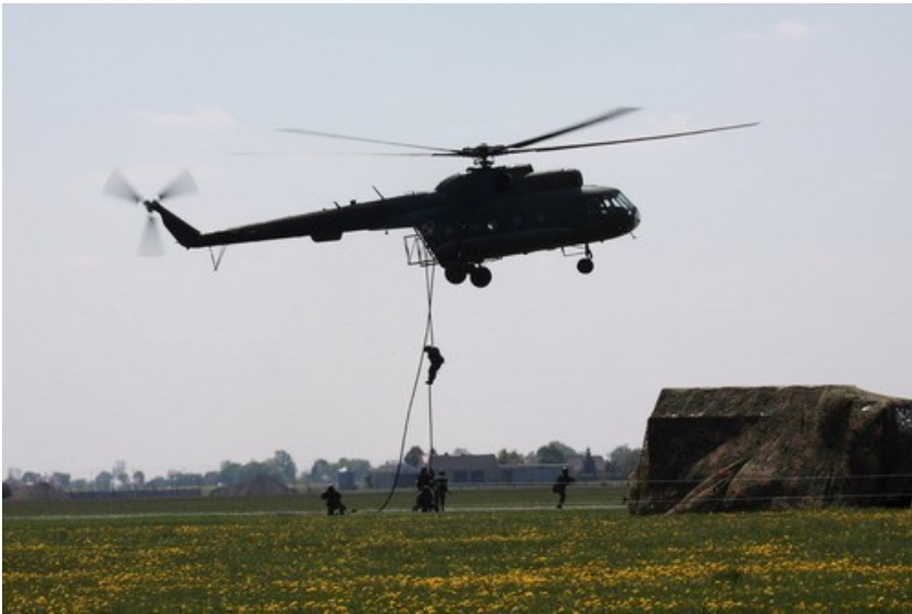
Desant grupy bojowej z pokładu śmigłowca Mi-8