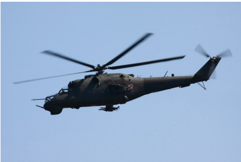
Wsparcie ogniowe zapewnia para Mi-24

W trakcie dynamicznej części prezentacji goście obejrzeni misję ratownictwa bojowego (Combat SAR), przeprowadzoną przez żołnierzy 7. batalionu kawalerii powietrznej, podczas której plutonowa grupa bojowa oraz śmigłowce Mi-24 (w wersji afgańskiej, z dodatkowym opancerzeniem), Mi-8 i W-3PL Głuszc wspóldziały ze sobą przy odbijaniu pilota uprowadzonego z rozbitego statku powietrznego. Jest to element ćwiczony przez polskich żołnierzy przed każdą kolejną rotacją PKW do Afganistanu.