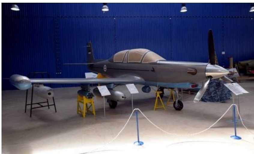
Prototyp Kobaca. Zwraca uwagę zaklejenie osłony kabiny załogi, co może świadczyć o braku wyposażenia wewnętrznego lub - co zdecydowanie mniej prawdopodobne - chęci utrzymania w tajemnicy konfiguracji i wyposażenia kokpitu / Zdjęcie: MO Serbii

W ub.r. serbski przemysł zbrojeniowy wyeksportował sprzęt o wartości 250 mln USD, m.in. do Indonezji, Kanady i USA. Wartość nowo podpisanych umów sięgnęła 600 mln USD.