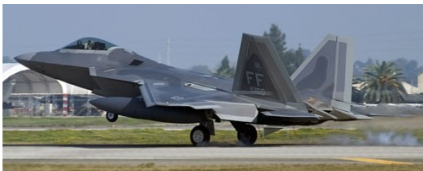
F-22 podczas pobytu w bazie Moron, w styczniu 2011

Według znanego blogera lotniczego, Davida Cenciotti, 6 F-22 przeleciało z USA do ZEA z międzylądowaniem w bazie Moron w Hiszpanii. Tam fotografowali je spotterzy, którzy zanotowali ich numery: 04-4078, 04-4081, 05-4093, 05-4094, 05-4098 i 05-4099 (na zdjęciu A. Muniza Zaragueta). To F-22 Block 30 z 49th Fighter Wing w Holloman AFB w Nowym Meksyku. 17 kwietnia wystartowały one z USA do misji określanej jako Mazda 91 , a do celu dotarły 4 dni później. Przelot nie był szczególnie utajniony, bo loty w Moron odbywały się za dnia.