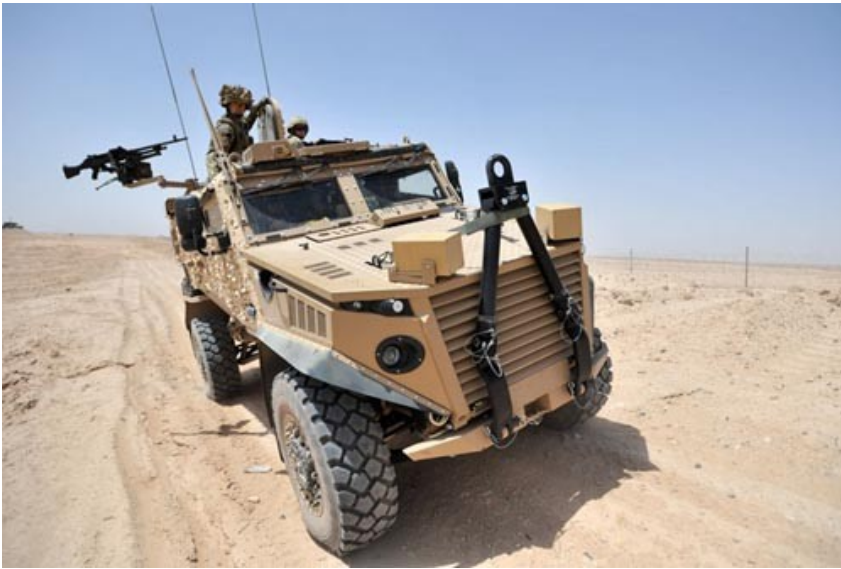
Jeden z Foxhoundów w Afganistanie

Pierwsza partia 200 Foxhoundów została zamówiona przez brytyjski resort obrony w listopadzie 2010. To właśnie kilka z tej grupy pojazdów trafiło kilka dni temu do Afganistanu. Nie zostały one od razu skierowane do zadań operacyjnych. Przechodzą obecnie serię ostatecznych testów na terenie prowincji Helmand.