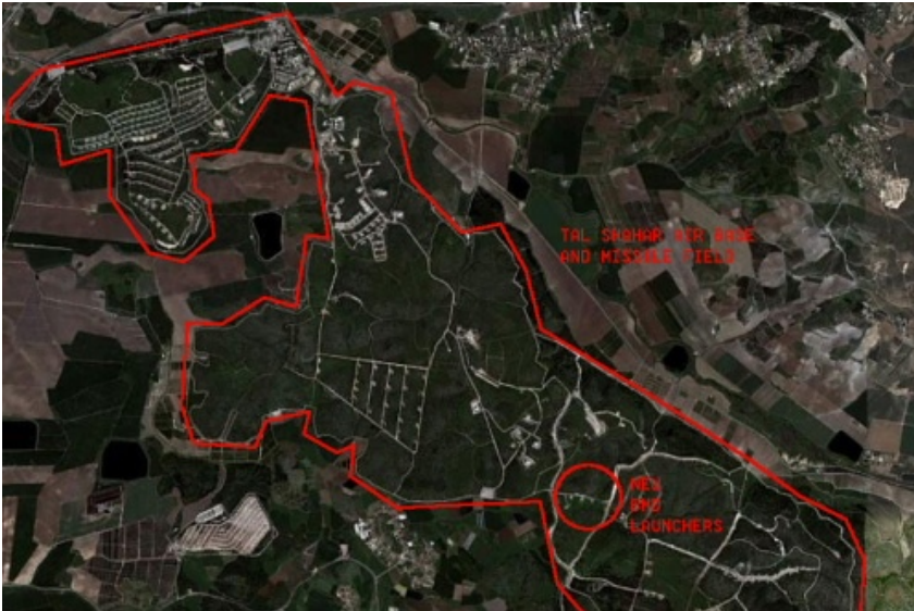
Lokalizacja bazy nałożona na mapę satelitarną

Amerykański Departament Obrony w ogłoszeniu dotyczącym udzielenia zamówienia publicznego, ujawnił lokalizację oraz szczegóły techniczne przyszłej izraelskiej tajnej bazy antyrakietowej.