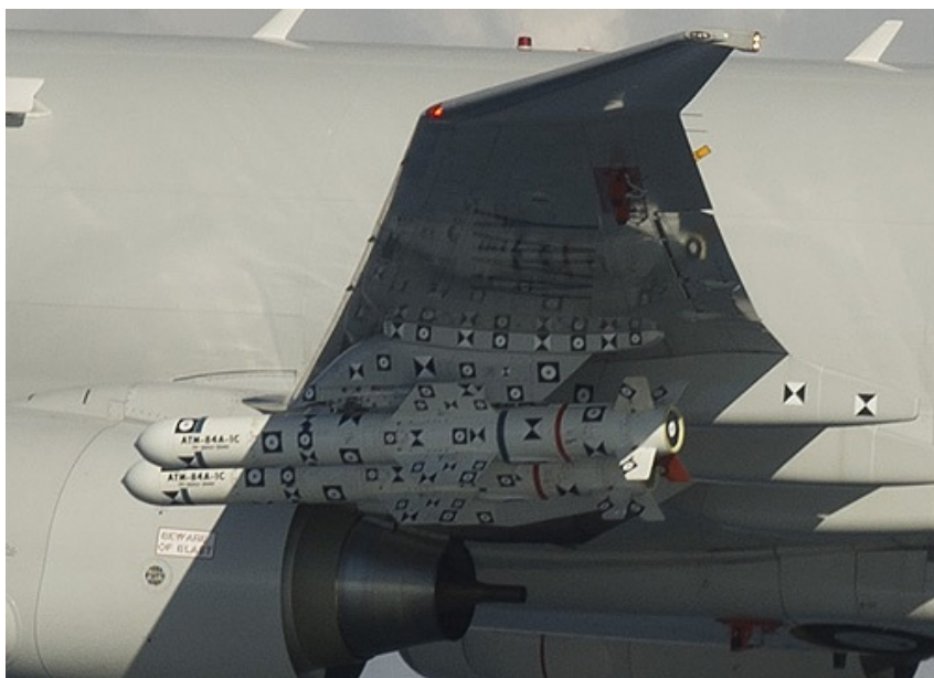
Testowe kpr Harpoon podwieszono pod skrzydłami Poseidona nr 954 podczas prób

Jednym z głównych założeń testowych była ocena integracji pocisku z przenoszącą go platformą. Według przedstawicieli NAVAIR próba zakończyła się powodzeniem. Poprzedziły ją trwające niemal rok przygotowania.