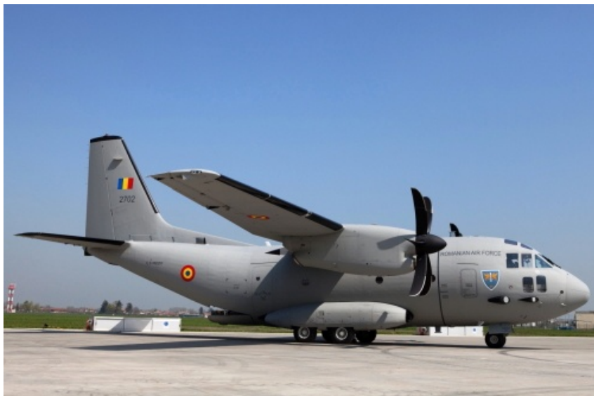
Rumuński C-27J Spartan użyty do prób nowego systemu gaszenia pożarów

Jeden z rumuńskich transportowców C-27J Spartan został wyposażony w nowy system gaszenia pożarów. Przeprowadzono już jego pierwsze próby.