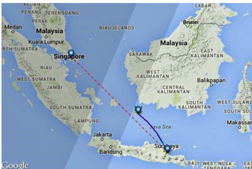
Trasa lotu A320 AirAsia wg FlightRadar24

Samolot pasażerski tanich linii lotniczych AirAsia A320 wystartował z Surabaya na Jawie Wschodniej (lot QZ8501) o 5.35 czasu lokalnego (21.35 GMT, 22.35 czasu polskiego CET). Na jego pokładzie znajdowały się 162 osoby, w tym 7 członków załogi – dwóch pilotów i 5 osób personelu pokładowego, oraz 155 pasażerów – 138 dorosłych, 16 dzieci i jedno niemowlę. Samolot miał wylądować o 8.30 czasu lokalnego (00.30 GMT/1.30 CET) na lotnisku Changi w Singapurze. Jednak o 7.24 (23.24 GMT/0.24 CET) utracono z nim kontakt.