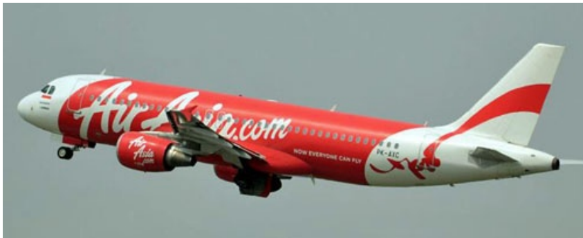
Airbus A320 nr rej. PK-AXC linii AirAsia

Około północy utracono kontakt z samolotem pasażerskim linii AirAsia A320 lecącym z Surabaya w Indonezji do Singapuru. Prawdopodobnie rozbił się on niedaleko wyspy Belitung.