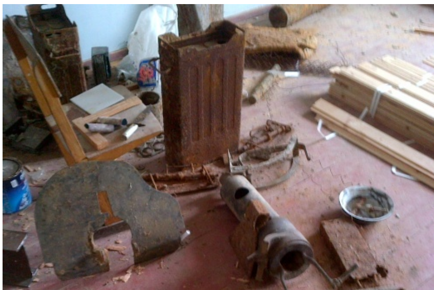
Niektóre przedmioty wydobyte z wraku jednostki

Należy dodać, że członkowie miejscowych organizacji zgromadzili, w pomieszczeniu przekazanym przez Radę Wiejską Ładyнки na potrzeby tworzonej izby muzealnej, wiele przedmiotów podjętych z terenu wokół wraku. Zostały one rozrzucone na skutek eksplozji spowodowanej przez załogę, mającej na celu zapobiegnięcie dostania się jednostki w ręce niemieckie. Wśród zgromadzonych elementów znajdują się m.in. koja marynarska, skrzynki na amunicję, akumulatory, pokrywy włazów, a także drzwi do jednej z wież artyleryjskich z zachowaną oryginalną mosiężną tabliczką, na której umieszczono napis w jęz. polskim Wieża armatnia I .