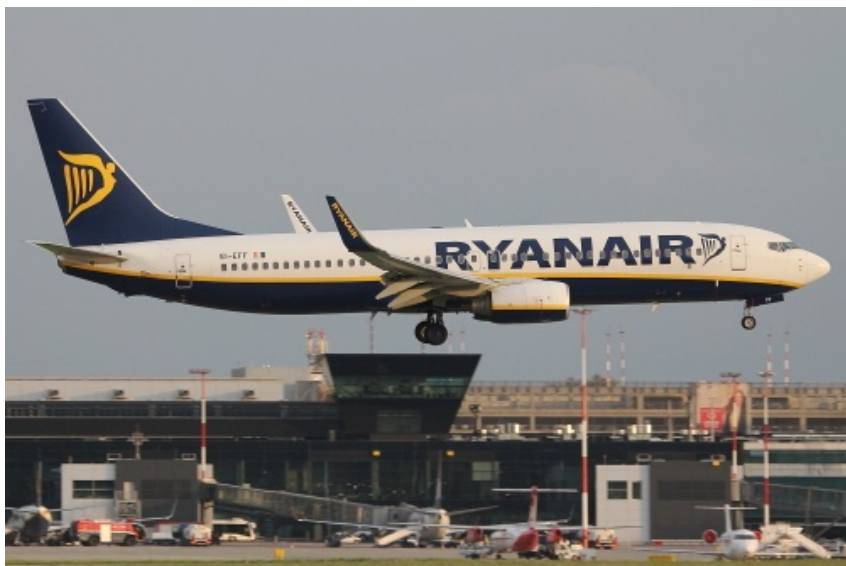
Ryanair uruchomi natomiast połączenia do Bournemouth i Belfastu

Po raz pierwszy na sezon zimowy pozostaną też połączenia PLL LOT do Gdańska (poranne rejsy od poniedziałku do piątku i codzienne wieczorem) i Ryanaira do Malagi (środy i soboty) i Cagliari (wtorki i soboty). Dodatkowo, w związku z zamknięciem lotniska w Oslo-Rygge, Ryanair uruchomi codzienne połączenie na lotnisko Oslo-Torp.