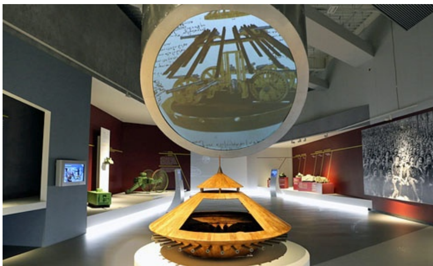
Makieta czołgu zaprojektowanego w 1485 przez Leonardo da Vinci. Według projektu, miał on miotać kamieniami i poruszać w dowolnym kierunku. Oslaniany był drewnianymi i metalowymi płytami

Ekspozycja Muzeum techniki pancernej znajduje się w czterech dużych halach o powierzchni 2,8 tys. m 2 . W centralnym miejscu umieszczono makietę czołgu zaprojektowanego przez Leonardo da Vinci. Eksponowane są też modele czołgów z początków XX wieku – rosyjskich, brytyjskich, niemieckich i francuskich.