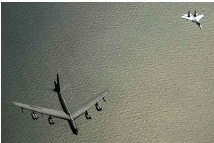
Rosyjski myśliwiec Su-27 w locie obok amerykańskiego bombowca strategicznego B-52H

W ostatnich dniach rosyjskie myśliwce kilka razy przechwyciły amerykańskie bombowce strategiczne B-52H i B-1B uczestniczące w ćwiczeniach Saber Strike i BALTOPS . 6 maja rano Su-27 przechwycił parę bombowców B-52H. Wczoraj doszło do kilku podobnych wydarzeń. Su-27 przechwyciły dwie pary bombowców B-52H i B-1B.