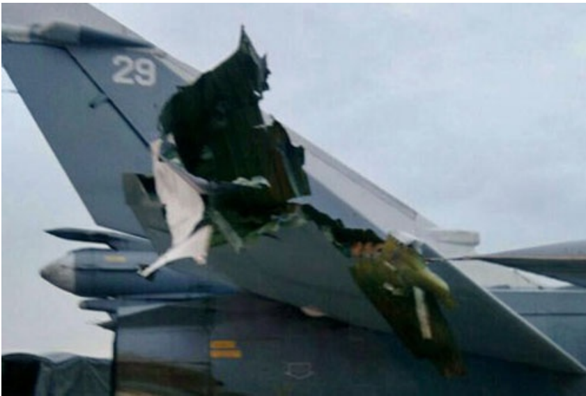
Uszkodzone usterzenie poziome bombowca frontowego Su-24M nr burtowy 29

Rosyjskie media poinformowały o ostrzeleniu 31 grudnia przez rebeliantów granatami moździerzowymi rosyjskiej bazy Hmejmim w Syrii. Podawano o zniszczeniu siedmiu samolotów (4 Su-24M, 2 Su-25S, An-72) i magazynu amunicji. MO FR zaprzeczyło tej informacji, ale przyznało, że baza została ostrzelana, w wyniku czego zginęło 2 żołnierzy (media informowały o co najmniej 10 rannych). Poinformowało też, że ochrona bazy Hmejmim została wzmocniona, a żołnierze rosyjscy i syryjscy zorganizowali akcję poszukiwania i schwytania terrorystów , którzy korzystając z ciemności uciekli niezidentyfikowanymi pojazdami.