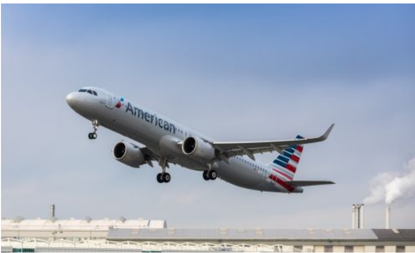
American Airlines nabyły największą ilość A321neo spośród linii w Ameryce Pn.

Linie odebrały swojego pierwszego A321neo w lutym 2019, a do 31 stycznia br. dostarczono im 70 samolotów tego modelu. American Airlines są największym na świecie operatorem samolotów rodziny A320, największym na świecie operatorem A321 (ceo i neo) oraz największym klientem A321neo w Ameryce Północnej ( Pierwszy A321neo dla American Airlines , 2019-02-03).