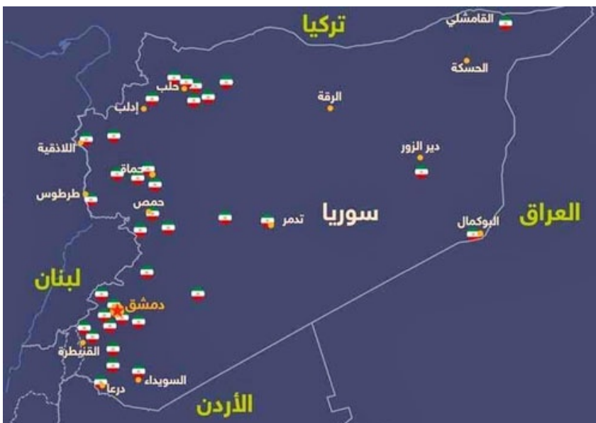
Położenie baz irańskich na terytorium Syrii

Według różnych źródeł, Irańczycy wystrzelili 9 maja w kierunku okupowanych przez Izrael Wzgórz Golan ok. 20 pocisków Grad i Fajr-5. Celami były ośrodki rozpoznania radioelektronicznego, bazy lotnictwa i ośrodki dowodzenia. Część z irańskich pocisków została zniszczona przez izraelską obronę powietrzną. Według Izraelczyków, żaden nie dosięgnął celu.