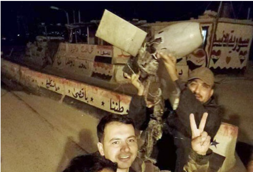
Fragmenty pocisku kierowanego Spike NLOS, który nie doleciał do celu, demonstrowane przez Syryjczyków

Według różnych źródeł, Irańczycy wystrzelili 9 maja w kierunku okupowanych przez Izrael Wzgórz Golan ok. 20 pocisków Grad i Fajr-5. Celami były ośrodki rozpoznania radioelektronicznego, bazy lotnictwa i ośrodki dowodzenia. Część z irańskich pocisków została zniszczona przez izraelską obronę powietrzną. Według Izraelczyków, żaden nie dosięgnął celu.