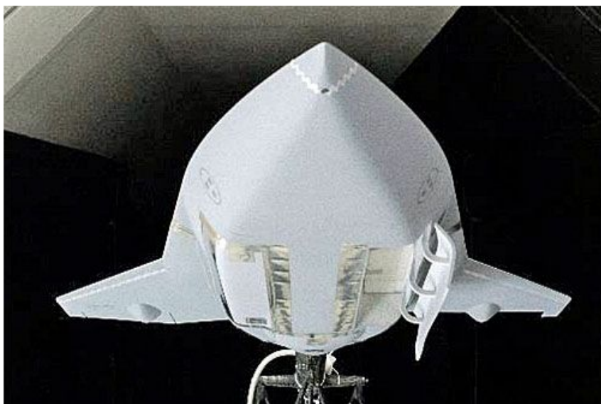
Ten sam model w widoku od spodu. Widoczne komory uzbrojenia umieszczone w kadłubie

Szwedzki koncern opublikował zdjęcia z prób makiety projektowanego naddźwiękowego bezzałogowca w tunelu aerodynamicznym. Były one realizowane w grudniu 2021 w tunelu L-2000 królewskiej politechniki w Sztokholmie. Prace finansowano ze środków własnych Saaba.