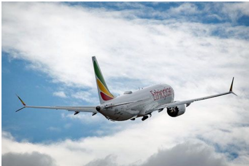
Samolot pasażerski Boeing 737 MAX 8 nr rej. ET-AVJ – pierwszy z 30 zamówionych przez Ethiopian Airlines, który rozbił się po starcie z Addis Abeby

Rozbity samolot to pasażerski Boeing 737 MAX 8 zn. rej. ET-AVJ nr ser. 62450/7243, należący do Ethiopian Airlines. Był to pierwszy samolot tego typu, który został dostarczony temu przewoźnikowi w listopadzie 2018. Został oblatany 30 października 2018.