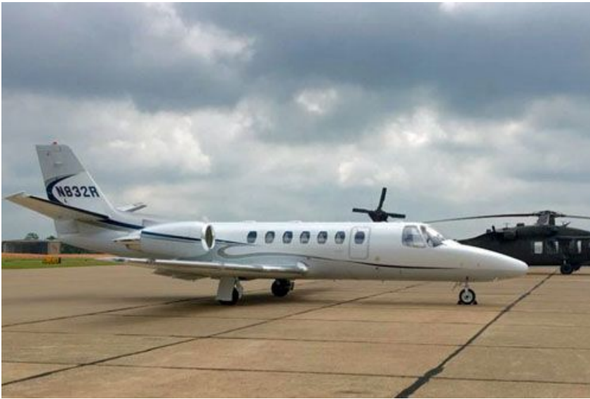
Cessna 560 Citation Encore nr rej. N832R

Rozbity samolot to dwusilnikowy odrzutowiec Cessna 560 Citation Encore nr rej. N832R, nr ser. 560-0585. Oblatano go w 2001. Jego operatorem było Hypo Consulting z Lantana na Florydzie.