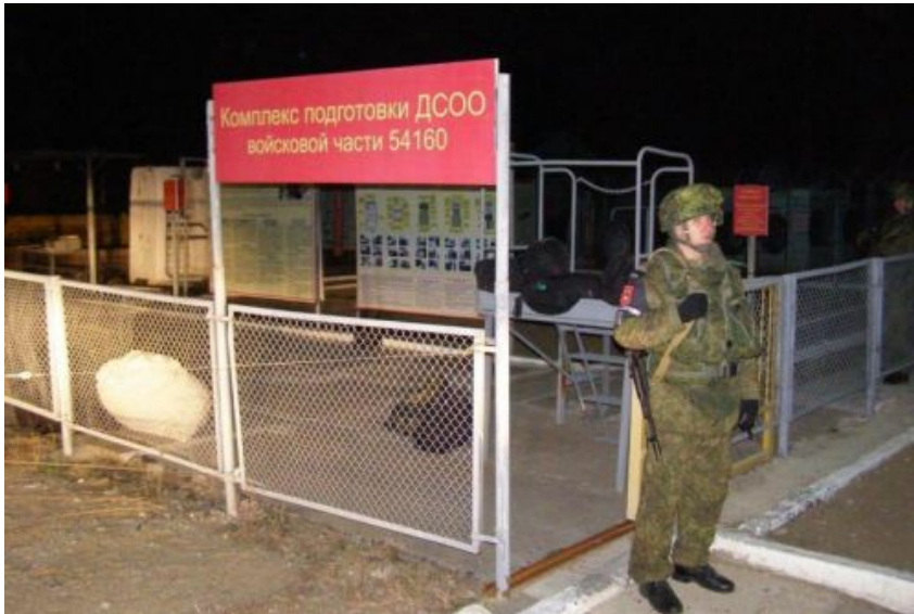
Teren jednostki wojskowej nr 54160, gdzie doszło do strzelaniny

Tymczasem rosyjska Nowaja Gazieta zamieściła kopię meldunku operacyjnego oficera dyżurnego struktury nr 31600 podpułkownika Kukalewicz, wysłanego w trzy godziny po tragedii, z którego wynika, że powodem dramatu w JW nr 54160 były niemożliwe do wytrzymania stosunki wewnętrzne w jednostce. Ciekawostką sprawy jest to, że jak melduje ppłk Kukalewicz – do tej specjalnej jednostki, związanej z bezpieczeństwem jądrowym Rosji kierowani są poborowi i żołnierze kontraktowi po specjalnej selekcji przeprowadzonej w 84. centrum szkolno-treningowym w Serijewom Posadie pod Moskwą. Tam właśnie wybrano Szamsutdinowa do służby w jednostce ochraniającej bazę techniczno-obsługową amunicji jądrowej.