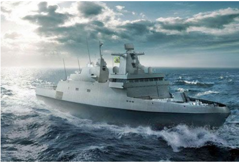
Wizja korwety dla floty brazylijskiej - Tamandare , projektowanej na bazie niemieckiego projektu MEKO A100 / Ilustracja: TKMS

Brazylijska państwowa organizacja projektowo-handlowa Emgepron zamówiła dla rodzimej marynarki wojennej 4 korwety na bazie niemieckiego projektu MEKO A100. Zamówienie zostało złożone w ramach realizacji programu Tamandare (CCT - Corvetas Classe Tamandaré). Korwety ma dostarczyć konsorcjum Águas Azuis, w którego skład wchodzi thyssekrupp Marine Systems (TKMS) oraz Embraer Defense & Security i Atech - oba z grupy Embraer.