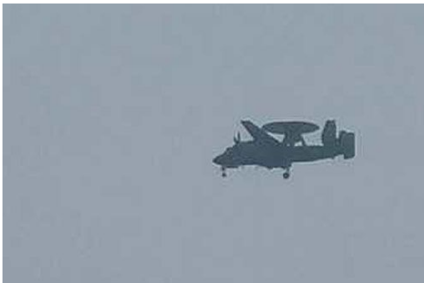
Chiński samolot rozpoznania dalekiego zasięgu i dowodzenia KJ-600 w pierwszym locie

29 sierpnia 2020 z lotniska zakładowego Xi'an Aircraft Industrial Corporation wystartował do pierwszego lotu chiński samolot rozpoznania dalekiego zasięgu i dowodzenia KJ-600. Seryjne samoloty tego typu mają stanowić wyposażenie lotniskowców, które obecnie powstają w ChRL. Są odpowiednikami amerykańskich E-2C Hawkeye.