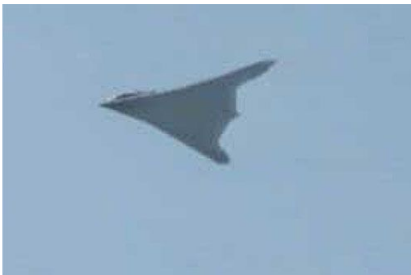
Bsl Hongdu GJ-11 w locie. To pierwsze takie zdjęcie

W chińskim Internecie (TheDeadDistrict) opublikowano pierwsze zdjęcie bojowego bsl stealth Hongdu GJ-11 w locie. Ten bezzałogowiec został ujawniony 1 października 2019 podczas defilady wojskowej w Pekinie, w 70. rocznicę powstania Chińskiej Republiki Ludowej ( Wielka parada w Pekinie, 2019-10-01 ). GJ-11 był również prezentowany na zamkniętym pokazie bsl w bazie lotniczej Malan. Pod koniec 2019 do sieci wyciekł jego obraz satelitarny z tego pokazu.