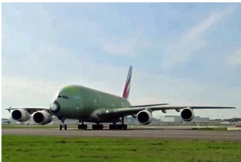
Ostatni Airbus A380 rozpoczyna testy lotniskowe. Tuluza, 11 marca 2021

Wczoraj, 11 marca 2021 w Tuluzie rozpoczęły się testy lotniskowe ostatniego wyprodukowanego samolotu pasażerskiego Airbus A380. Testowane są silniki, systemy pokładowe i sterowanie podwoziem. Wkrótce samolot o numerze seryjnym 272 ma zostać oblatany. Po zakończeniu testów maszyna poleci do Hamburga, gdzie zostanie ostatecznie wyposażona i pomalowana w barwy Emirates – linii, dla których jest przeznaczona.