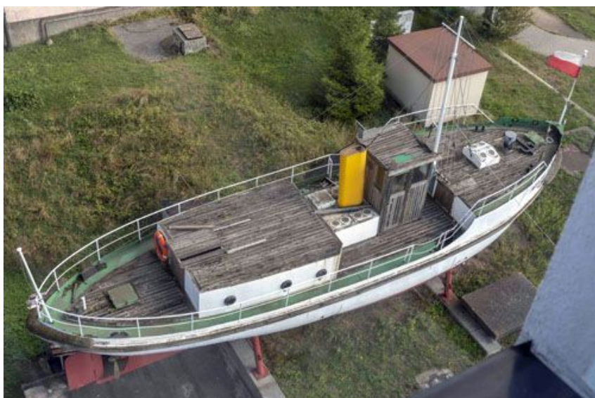
Samarytanka przed biurowcem dawnej stoczni

W nocy z 26 na 27 października 2021 do Muzeum Marynarki Wojennej w Gdyni ma zostać przetransportowana, z zachowaniem specjalnej troski, historyczna pierwsza przedwojenna jednostka zaprojektowana i zbudowana w Stoczni Gdyńskiej. Jest to przechowana do tej pory duża motorówka sanitarna – Samarytanka .