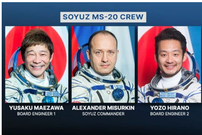
Uczestnicy komercyjnej misji kosmicznej Sojuza MS-20