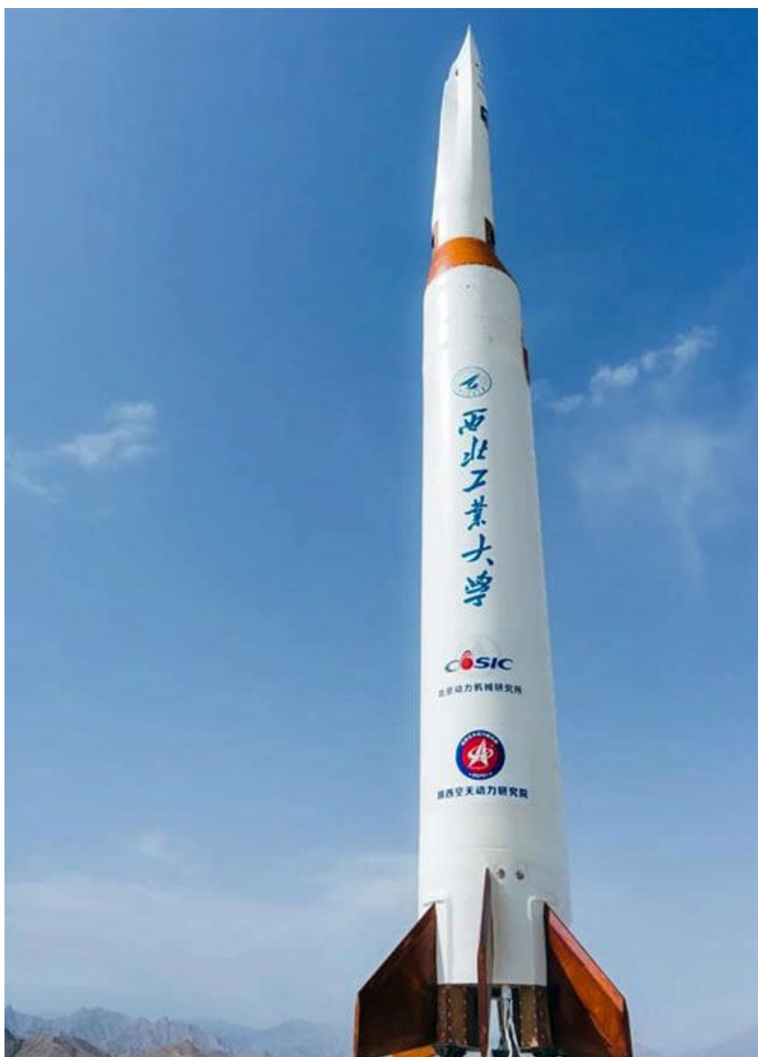
Rakieta z pojazdem doświadczalnym Feitian-1 wykorzystanym we wczorajszym teście wielotrybowego napędu hybrydowego

Wczoraj, 4 lipca 2022 chiński Zespół Innowacji Energetyki Kombinowanej NWPU (Northwestern Polytechnical University) i grupa raketowa CASIC przetestowały rakietę Feitian-1 z wielotrybowym napędem hybrydowym – raketowym i strumieniowym. Test przeprowadzono z bazy w północno-zachodnich Chinach. Rakieta płynnie zmieniała tryby napędu w czasie lotu. Paliwem była kerozyna (nafta lotnicza).