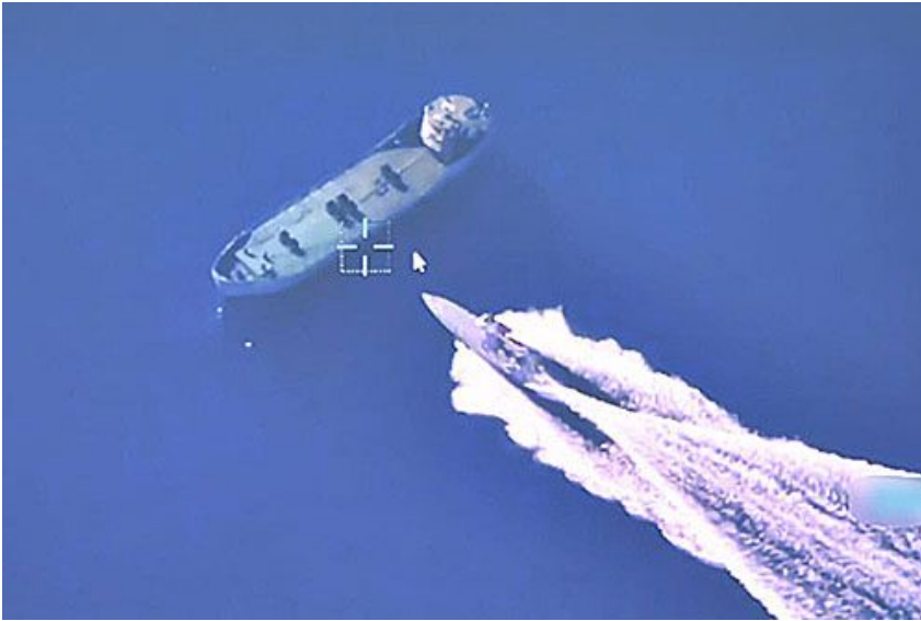
Statek-cel na chwilę przed trafieniem przez bojowy bezzałogowiec pływak Albatros

Podczas testu turecki pływak bezzałogowiec Albatros zatopił statek. Test został zrealizowany na poligonie na Morzu Śródziemnym u wybrzeży Mersin. Brało w nim udział 8 pojazdów Albatros operujących w roju. W wyniku trafienia 22-metrowy statek zatonął w ciągu kilku minut. Cel przed testem został umyty i oczyszczony z zanieczyszczeń, takich jak paliwo i olej, aby nie szkodzić środowisku.