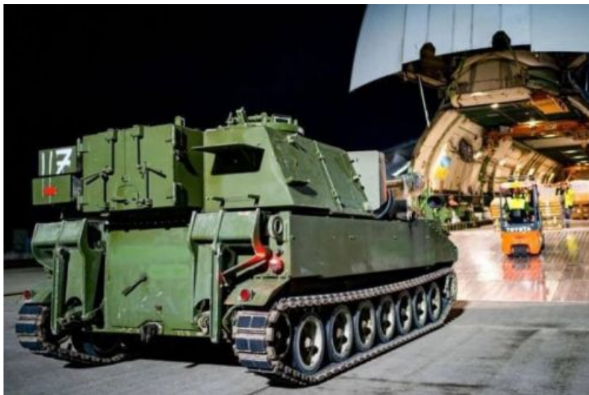
Norwegia wysłała do tej pory na Ukrainę 22 armatohaubice M109A3GN kal. 155 mm

Lokalne media podały, że Norwegia przekazała Ukrainie dodatkowy sprzęt i uzbrojenie. Stacja TV2.no post factum opublikowała szereg zdjęć z portu lotniczego w Oslo, ale podkreśliła, że ładunek został dostarczony z zachowaniem tajemnicy. O transporcie poinformowano niewielką grupę osób. Norweskie źródła masowego przekazu podały, że w dniu załadunku na lotnisko Gardermoen w Oslo przyleciał jeden z największych na świecie samolotów transportowych – An-124 linii Antonov Airlines. Podkreślono również, że zarówno linia lotnicza, jak i załoga były z Ukrainy.