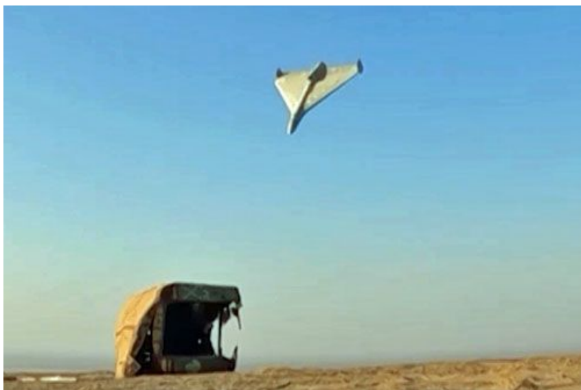
Nowy irański bbsl z napędem turboodrzutowym w ostatniej fazie ataku na cel lądowy

Nie podano parametrów technicznych nowego bbsl. Biorąc pod uwagę różnice charakterystyk napędu śmigłowego i odrzutowego można się spodziewać, że ma on mniejszy zasięg, ale rozwija większą prędkość. W praktyce można uznać nowy bbsl za mały pocisk samosterujący.