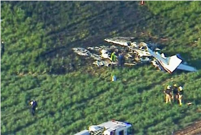
Wrak samolotu Reims-Cessna F406 Caravan II, który znaleziono na polu niedaleko Oakey w Australii

Dzisiaj, 20 lipca 2025 o 14:26 z lotniska Warwick w Queensland w Australii wystartował dwusilnikowy samolot Caravan II. Na jego pokładzie znajdowały się 2 osoby. Mieli lecieć do Brisbane – stolicy stanu.