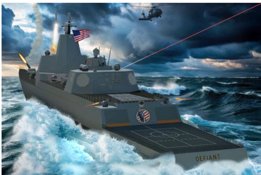
Wizja dużego okrętu nawodnego dla US Navy – BBG(X) / Ilustracja: US Navy

Projektowaniem nowych okrętów ma kierować US Navy. Trump dodał, że prace nad projektem rozpoczęły się podczas jego pierwszej kadencji prezydenckiej (2017-2021). Nowe okręty mają być wyposażone w broń hipersoniczną, elektryczne działa elektromagnetyczne, pociski manewrujące uzbrojone w głowice jądrowe (SLCM-N) i najnowocześniejsze systemy laserowe. – Będą największymi okrętami, jakie kiedykolwiek zbudowano – powiedział amerykański prezydent. Ich wyporność ma wynosić 30-40 tys. ton. Okręty będą sterowane przez sztuczną inteligencję – dodał.