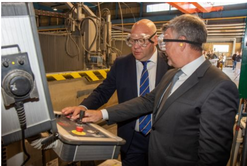
Dostawy jednostek typu Pohjanmaa zaplanowano na lata 2027-2029

W zakładach Saaba w Karlskronie odbyła się uroczystość cięcia kompozytów pod pierwszy maszt fińskiej korwety typu Pohjanmaa . Łącznie przedsiębiorstwo dostarczy 4 takie maszty dla przyszłych fińskich okrętów nabywanych w programie Squadron 2020. Saab jest jednym z podwykonawców kontraktu a zamówienie otrzymał we wrześniu 2019.