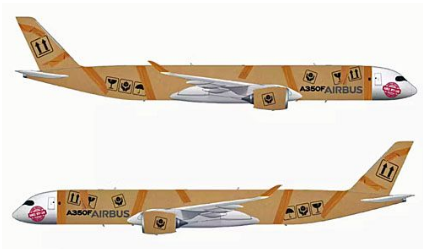
Projekt malowania A350F zaproponowany przez Johna Feehana, grafika z Dublina w Irlandii / Ilustracja: Airbus

W tej sytuacji wybór był bardzo trudny i czasochłonny. Ostatecznie zwyciężyły dwa bardzo podobne do siebie projekty, które jury Airbusa postanowiło połączyć w jeden. Ich twórcy otrzymali w nagrodę zaproszenie na Paris Air Show i modele A350F w nowym malowaniu. Zostaną też zaproszeni na pierwszy lot A350F. Konkurs nie przewidywał nagrody pieniężnej.