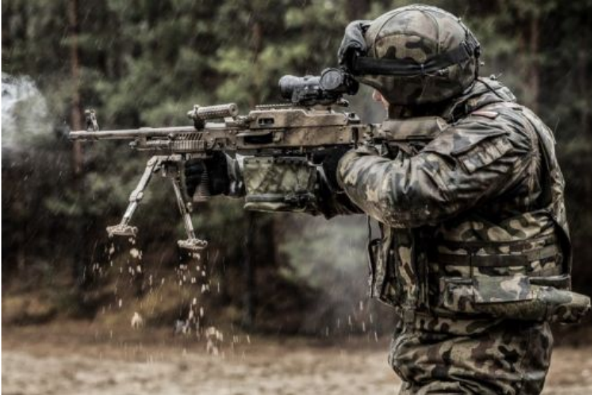
Uniwersalny karabin maszynowy UKM-2000P

Agencja Uzbrojenia MON i Zakłady Mechaniczne Tarnów podpisały dzisiaj, 13 czerwca 2023, umowy na dostawy broni strzeleckiej dla Sił Zbrojnych RP. Obejmują dostawę kilkuset uniwersalnych karabinów maszynowych UKM-2000P i kilkudziesięciu wielkokalibrowych karabinów wyborowych Tor. Ich łączna wartość to ok. 69 mln PLN brutto.