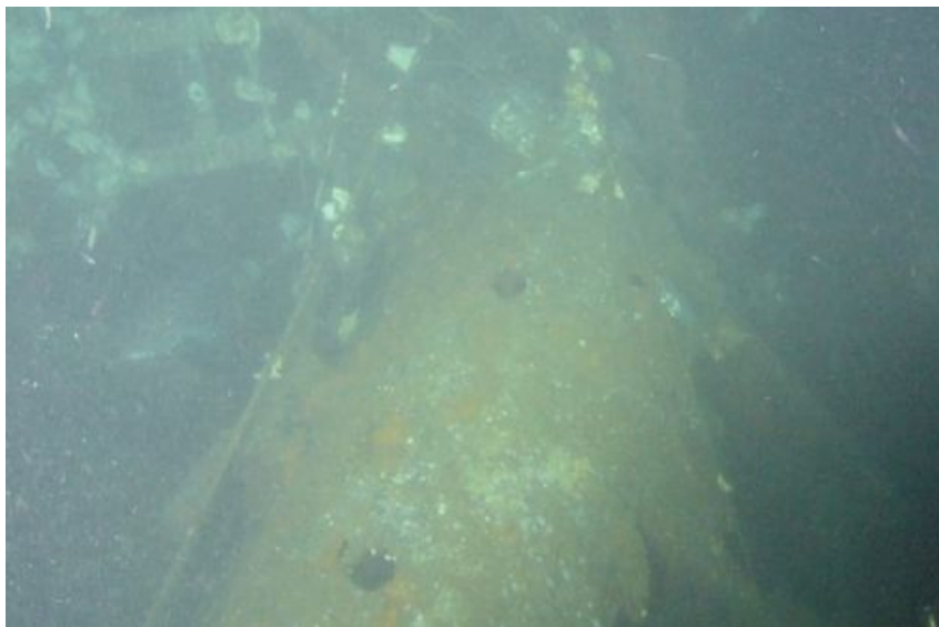
Zdjęcie wraku USS Albacore wykonane przez zespół badawczy z Uniwersytetu Tokijskiego

Naval History and Heritage Command (NHHC) opublikowało komunikat potwierdzający identyfikację podwodnego wraku nieopodal Hokkaido jako amerykańskiego okrętu podwodnego USS Albacore (SS 218) typu Gato z okresu II wojny światowej.