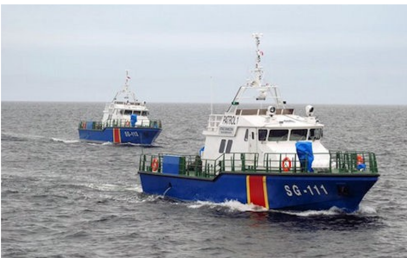
Nowe, zbudowane w Estonii patrolowce Straży Granicznej podczas prób odbiorczych