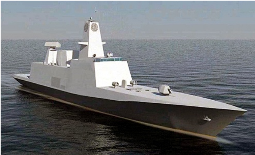
Artystyczna wizja nowej fregaty Projektu 17A trudnowykrywalnej dla radarów / Rysunek: Trishul

Indyjska Defence Acquisition Council (DAC) zatwierdziła program budowy fregat stealth - Project 17A. Jego wartość ma wynieść 450 mld rupii (9,2 mld USD).